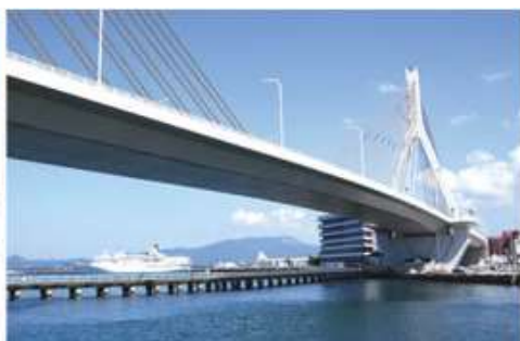
Мост Aomori Bay, Јапонија