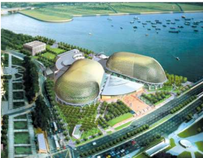
Esplanade Theatre on the Bay СИНГАПУР

За Хурех, еколошките стандарди се постојана обврска. Зголемувањето на животниот век на бетонските конструкции, обезбедувањето енергетска ефикасност, намалувањето на влијанието врз локацијата, намалувањето на испарливи органски соединенија (VOC) и користењето материјали кои се нетоксични, етички и одржливи – овие се еколошките придобивки кои Хурех произвите ги обезбедуваат во светот на градежништвото и стремежот кон еколошка одржливост.