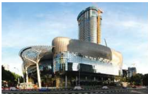
Трговски центар ION Orchard, Сингапур

Поморски конструкции Поморските конструкции од армиран бетон се постојано изложени на напад од штетни ефекти на влага и корозија предизвикана од хлорид. Штом влагата и хлоридите дојдат до армираниот челик, започнува експанзивен процес на оксидација кој предизвикува формирање пукнатини и ронење на бетонот. Технологијата со кристализација на Хурех се користи кај поморските конструкции за обезбедување водонепропустливост, заштита, поправка и подобрување на трајноста на бетонот кој е изложен на напад од вода и хлорид.