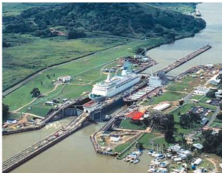
Панамски канал ПАНАМА