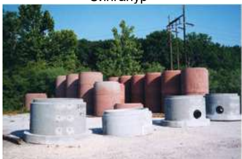
Бетонски отвори, Њу Орлеанс, САД