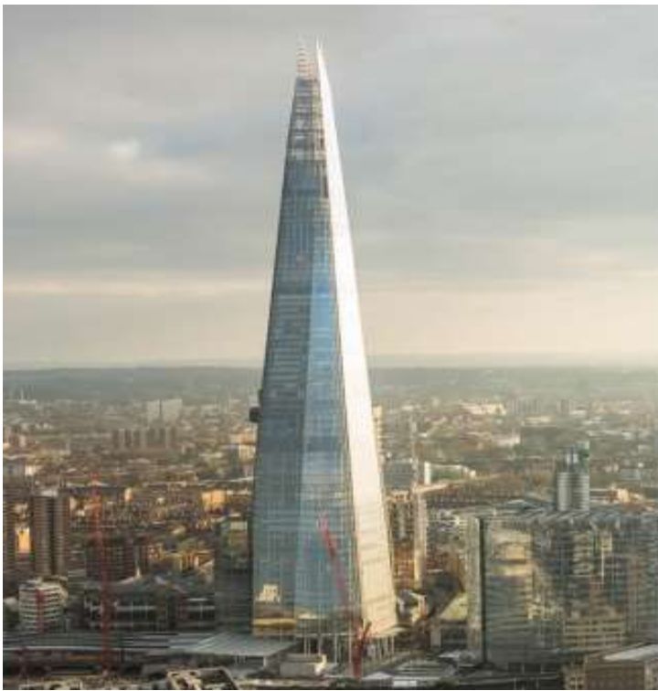
The Shard ОБЕДИНЕТО КРАЛСТВО