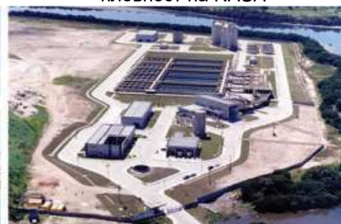
Пречистителна станица за отпадни води Allegria, Бразил