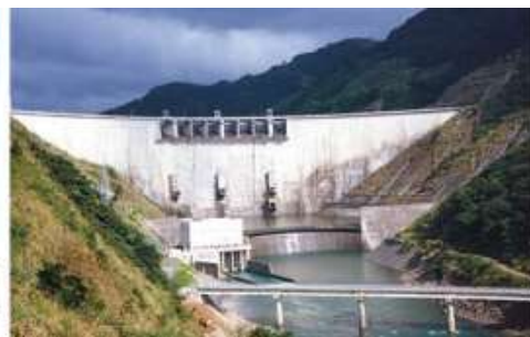
Брана Feitsui, Тајван