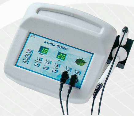
Medio SONO2 eco (1800504)