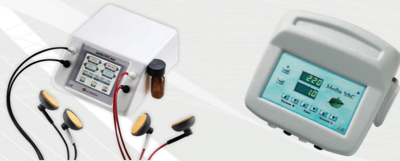
Medio VAC (1800220)