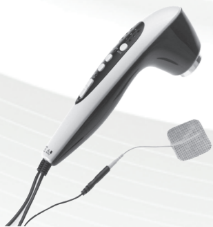
Medio UniSONO mini (1800534)

Двоканален преносен уред со ТЕНС и мускулна електрична стимулација.