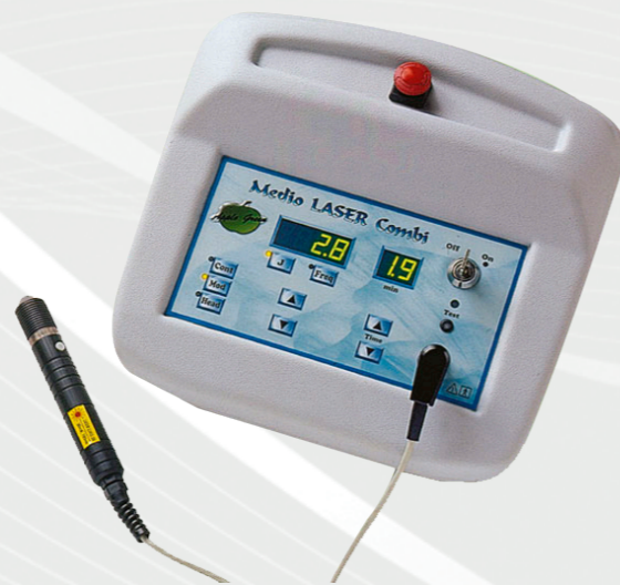
Medio LASER Combi (1800280)

Ласерскиот туш за овој апарат е со 708nm бранова должина и површина на плочка од 10cm 2 и 20cm 2 .