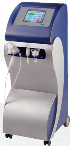
Green VAC Exclusive (1800371)

Патентираната радијална ендодермна терапија заснована на пулсирачки вакуум и специјално обликуваните апликатори со ротирачки топчиња, создава ефект на кружни кожни набори кои истовремено го масираат и растегнуваат сврзното ткиво. Преку овие апликатори на VAC апаратите на Iskra Medical се овозможува подобрување на микроциркулација, зголемување на еластичноста на сврзното ткиво, израмнување на кожата и лимфна дренажа.