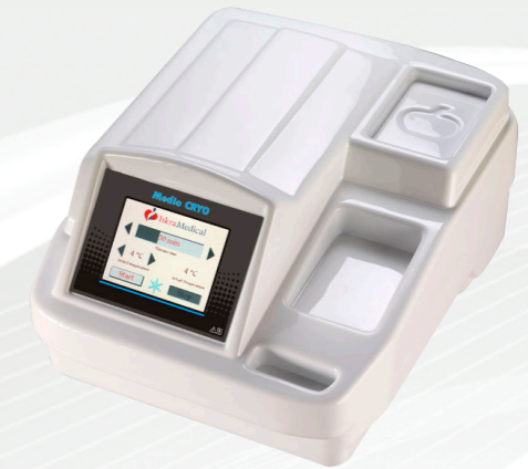
Medio CRYO (1800250) / Medio CRYO Prestige (1800522)