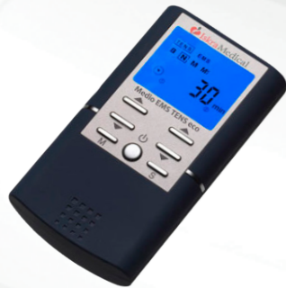
Medio EMS TENS eco (1800505)

Двоканален преносен уред со ТЕНС електрична стимулација.