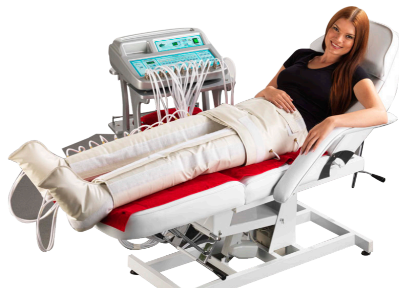
Green PRESS 12 (1800105)

Апарат за лимфна дренажа со 8 комори на манжетна кој содржи преконачурирани 7 програми на работа и можност за конфигурирање на уште 14 индивидуални програми.