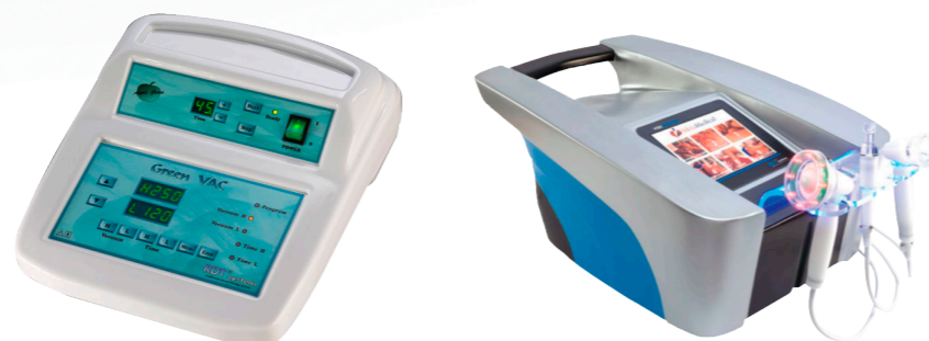
VAC Prestige (1800387)