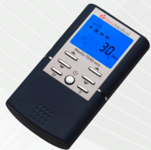
Medio TENS eco (1800508)

Двоканален преносен уред со ТЕНС електрична стимулација.