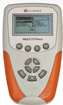
Multi STYM eco (1800509)

Преносен уред за ултразвучна терапија (1Mhz) со електротерапија.