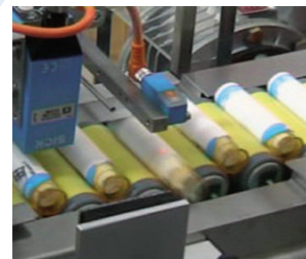
■ Controllo avvenuta etichettatura CS03-CS04-CS05 ■ Label presence control CS03-CS04-CS05 ■ Контрола за присуство на етикети CS03-CS04-CS05