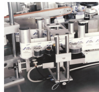
■ Marcatore a caldo SC15 ■ Hot-foil printing unit SC15 ■ Термал трансфер принтер SC15