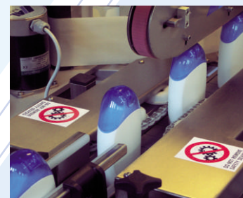
■ Orientatore a catenelle ME12 ■ Chains orienting unit ME12 ■ Систем за ориентација со ланци ME12