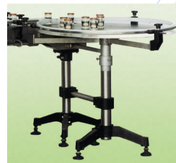
■ Tavola rotante di accumulo MT19 ■ Out feed rotary table MT19 ■ Ротациона маса за акумулирање MT19