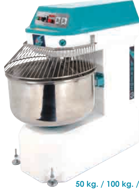
50 kg. / 100 kg. / 150 kg.