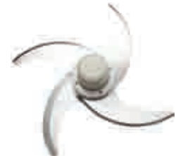
UZK-03 Sebze Parçalama ve Humus Bıçağı Vegetable and Hummus Blade