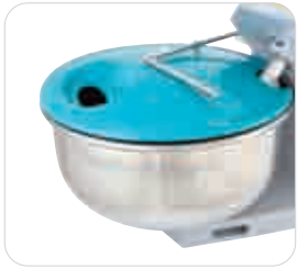
Opsiyonel plastik kapak Optional plastic lid