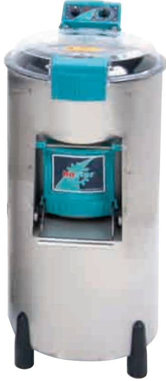
10 / 25 / 35 kg.