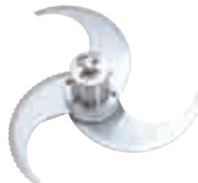
Et ve Sebze Parçalama Bıçağı Meat and Vegetable Blade