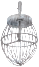
Çırpma Teli Whisk