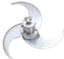
UZK-02 Et ve Sebze Parçalama Bıçağı Meat and Vegetable Blade