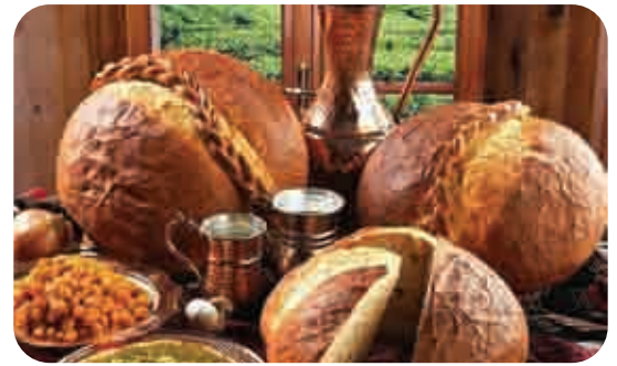
STANDART EKMEK STANDARD BREAD