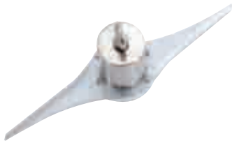
Humus Bıçağı Hummus Blade *Optional