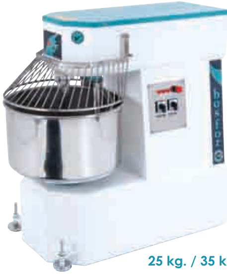
25 kg. / 35 kg.