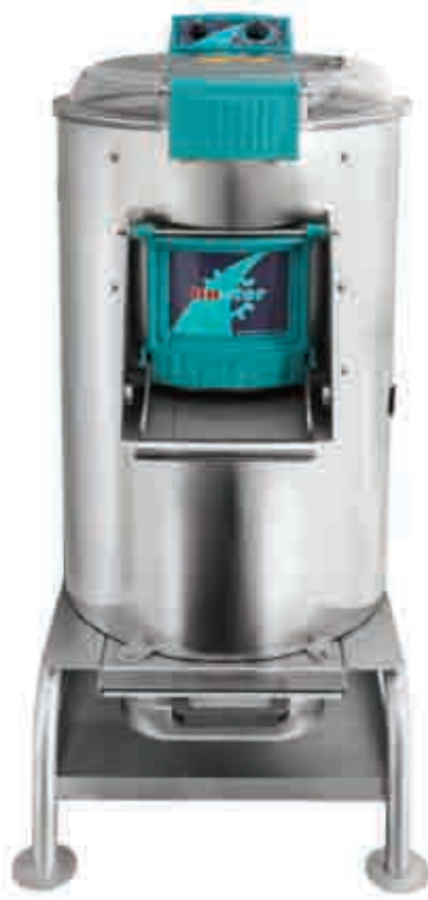
10 / 25 / 35 kg.