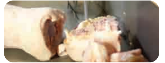
PASLANMAZ GÖVDE STAINLESS STEEL