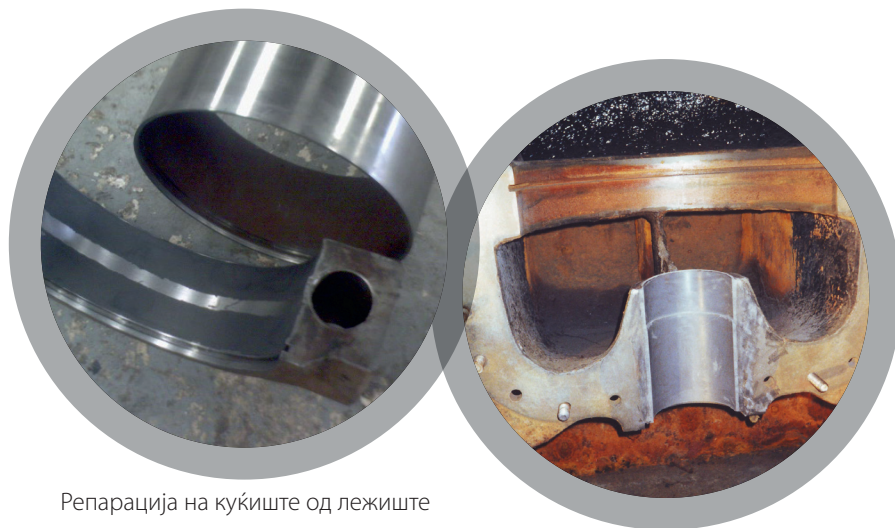
Репарација на куќиште од лежиште